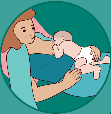
nazad nagnut položaj