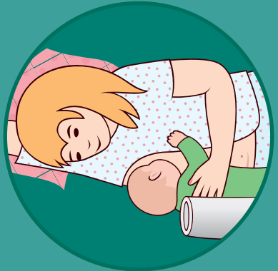
dojenje u ležećem položaju