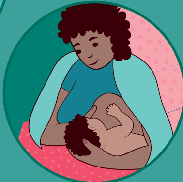
beba sa strane